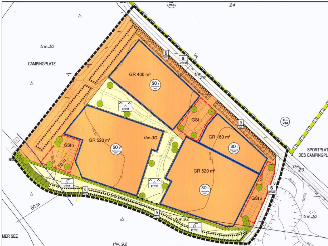
Abb. 2: Auszug aus dem Ursprungsplan Bebauungsplan Nr. 9, Teilbereich 2 der Gemeinde Salem

sportliche und sonstige Freizeitwecke sowie Einfriedungen. Die Nutzung der Campinghäuser ist hierbei auf die Zeit vom 01.04. bis 31.10 begrenzt.